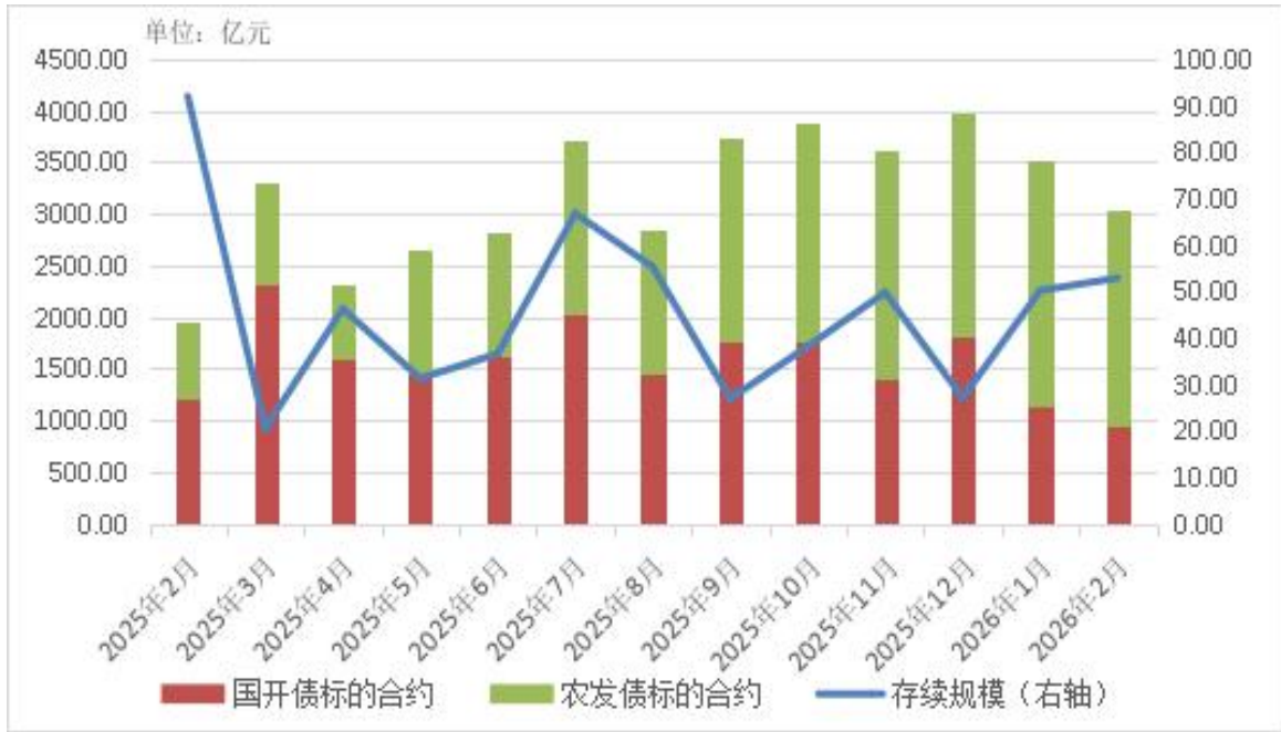
图4 近一年标准债券远期集中清算月度规模和月末存续规模

截至2月末，标准债券远期集中清算业务共有综合清算会员8家、普通清算会员43家、代理客户52家。当月通过综合清算会员代理清算90笔，规模258亿元，代理清算占比4.2%。