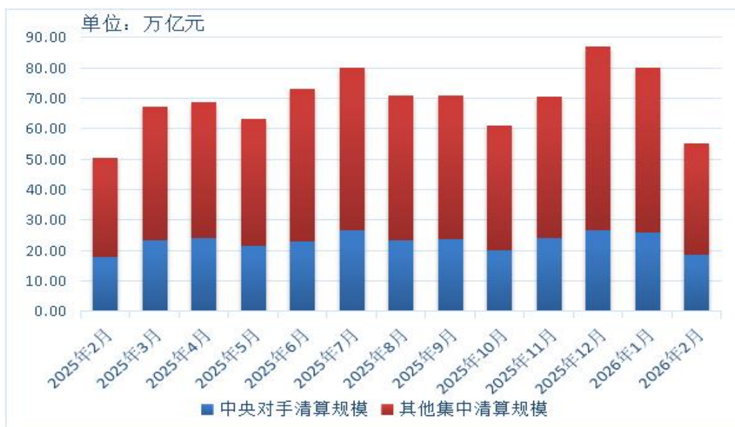
图1 近一年集中清算业务规模月度情况

2026年2月，上海清算所集中清算业务规模达到55.3万亿元，同比增长9.3%。其中，中央对手清算18.6万亿元，同比增长4.5%；其他集中清算36.7万亿元，同比增长12%。