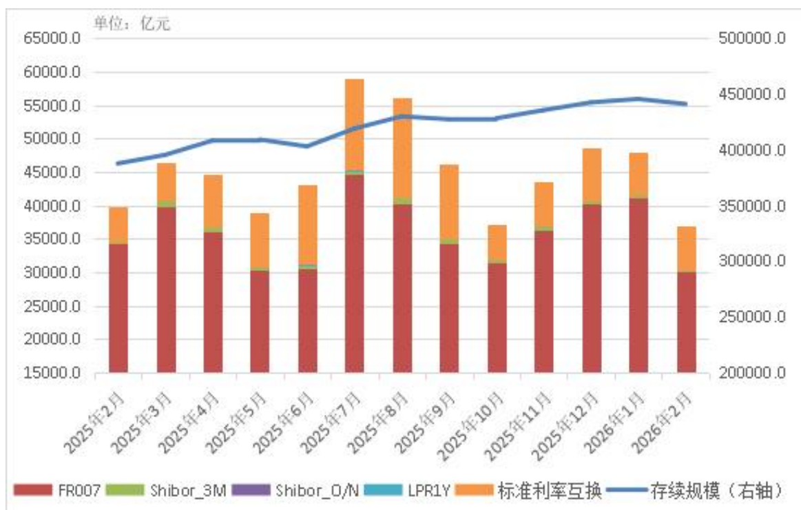
图3 近一年人民币利率互换月度清算规模和月末存续规模

2026年2月，清算“北向互换通”交易686笔、3797.59亿元。全年累计清算1673笔、9563.58亿元。累计入市“北向互换通”境内报价商23家，境外投资者88家。