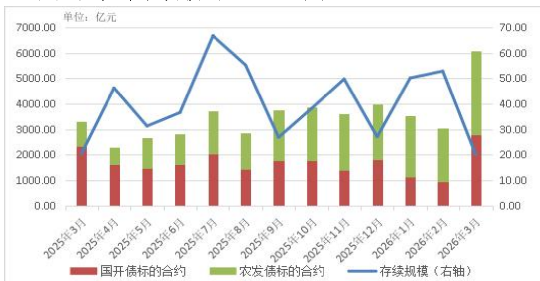
图 3 近一年标准债券远期集中清算规模和存续规模月度变化

一季度，共清算标准债券远期交易 3917 笔，名义本金合计 1.26 万亿元，同比增长 93.2%。从标的类型看，参考国开债的 4853 亿元，参考农发债的 7783.6 亿元。