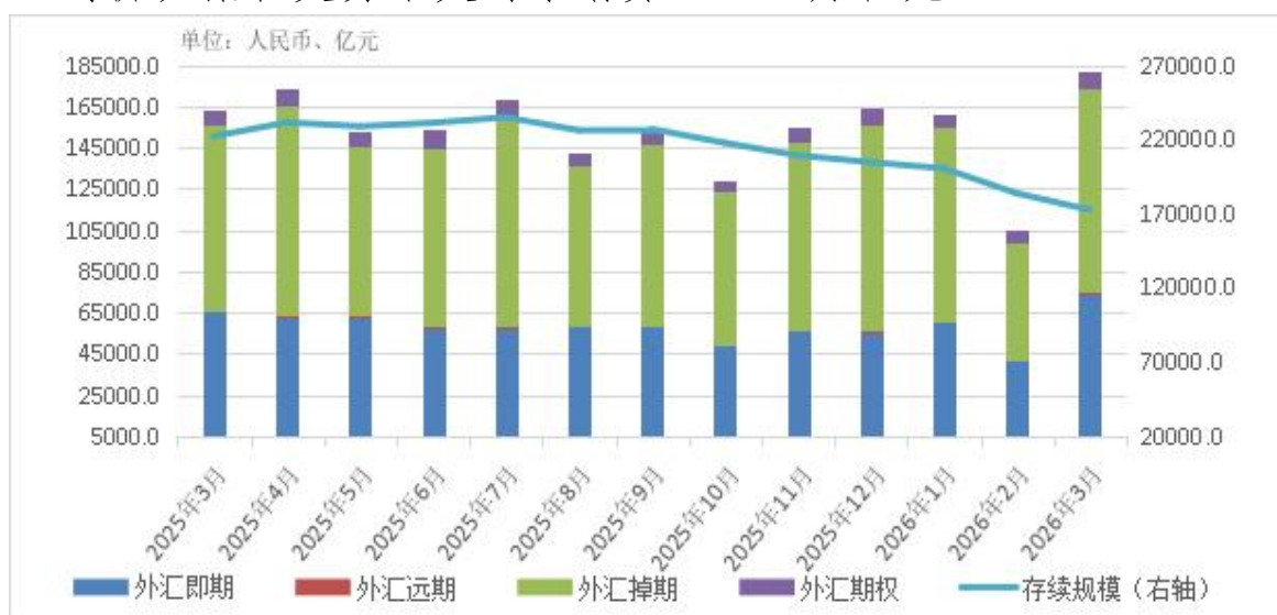
图4 近一年各外汇产品中央对手清算规模和存续规模月度变化

一季度，共清算外汇交易86.26万笔，规模合计44.76万亿元，同比增长8.1%。从产品类型看，外汇即期17.58万亿元，外汇远期1695.43亿元，外汇掉期25.03万亿元，外汇期权1.98万亿元。从交易方式看，外汇竞价交易清算2209.07亿元，外汇询价及撮合交易中央对手清算44.54万亿元。